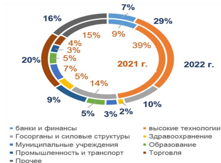
Рис. 2. Отраслевое распределение утечек информации в РФ за 2021-2022 гг.

Значительно чаще стали утекать ПДн из организаций отраслей промышленности, транспорта, торговли (рис. 2). Это связано как с внешними факторами (политической ситуацией в стране), так и с внутренними факторами, и может свидетельствовать о недостатках в обеспечении надежными средствами защиты баз данных организаций, содержащих значительный объем ПДн.